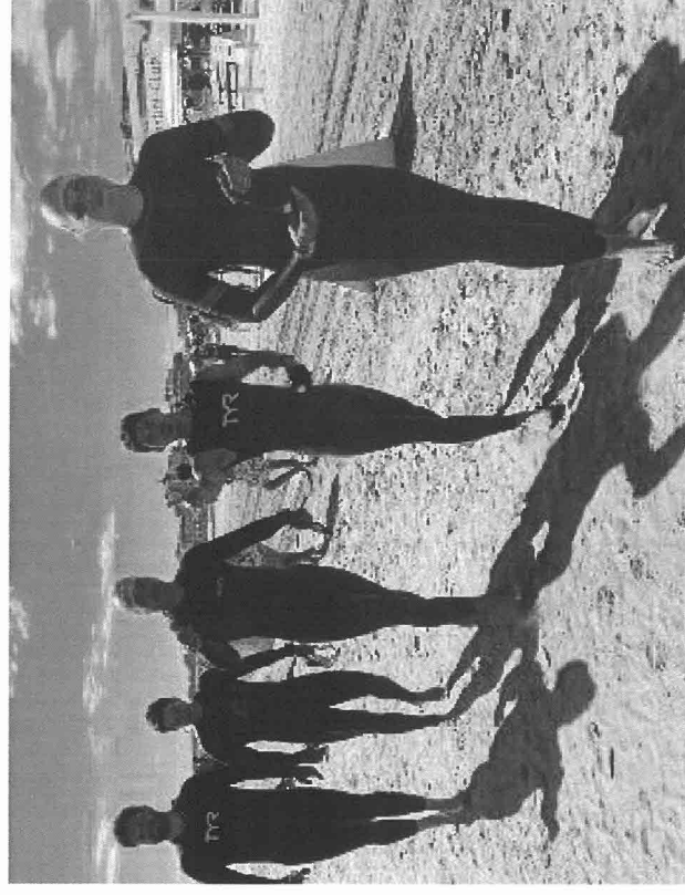
L'allenamento di alcuni atleti sulla spiaggia di Cervia

svolgeranno sia la 'lunga distanza' di Ironman Italy Emilia Romagna, con partenza della prima batteria dalla spiaggia libera di Cervia alle 7.15, mentre alle 10.30 partirà la prima batteria della 'mezza distanza' ossia la 70.3. Annullata, invece, la distanza olimpica della 5150 alla quale hanno dovuto rinunciare 300 atleti. Ciò vuol dire che oggi saranno quasi 7.000 gli atleti da gestire nelle due distanze con una macchina organizzativa che dovrà essere impeccabile.