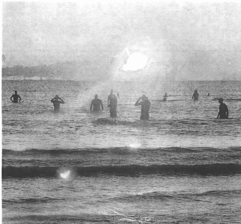
Sopra, i triatleti "saggiano" le condizioni dell'acqua alle prime luci dell'alba