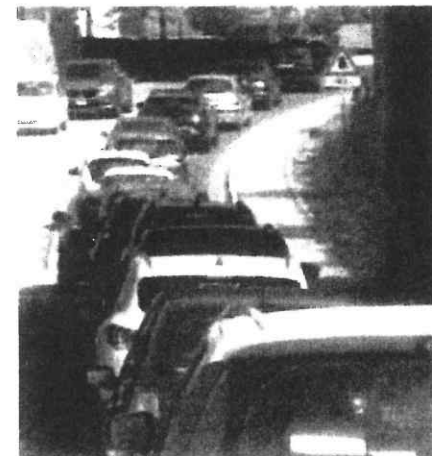
Lunghe code ieri mattina sulla via Emilia per il passaggio dell'Ironman a Cesena

Fortunatamente non si sono verificati incidenti particolari, ma i rallentamenti si sono protratti nell'arco di tutta la giornata, in special modo durante la mattina. Oggi, in occasione della seconda e ultima giornata della manifestazione sportiva, torneranno in vigore le stesse disposizioni.