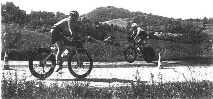
La prova di ciclismo che gli atleti hanno effettuato a Bertinoro, nel Forlivese. Sopra la maratona