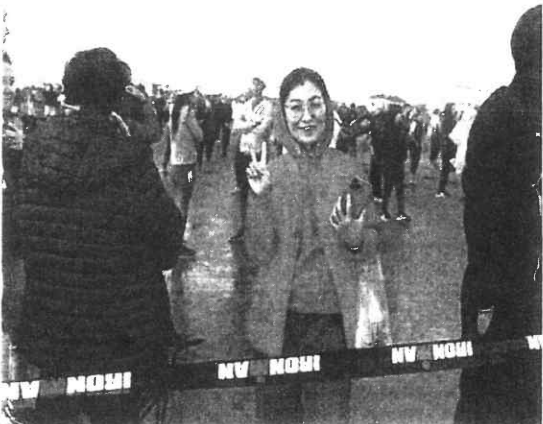
Una tifosa arrivata dall'Oriente in Romagna