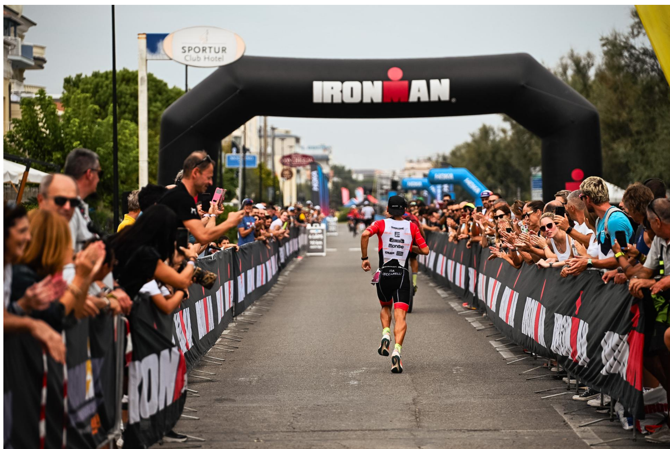
Foto (utilizzo editoriale gratuito con menzione dei credits fotografici):