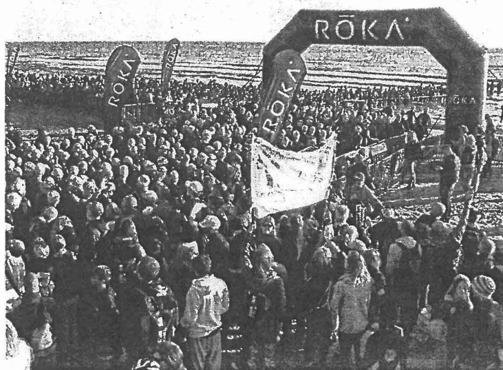
La partenza dell'ultima edizione del 2019

Un format collaudato e di successo che vede Regione, Comune e il marchio Ironman rinnovare l'accordo fino al 2025. «Il grande sport continua a essere protagonista nella nostra regione - afferma il presidente della regione Stefano Bonaccini - in un weekend da incorniciare. L'Emilia-Romagna si conferma terra di sport e di grandi manifestazioni nazionali e internazionali, in un binomio, sport e valorizzazione territoriale, di grande effi-