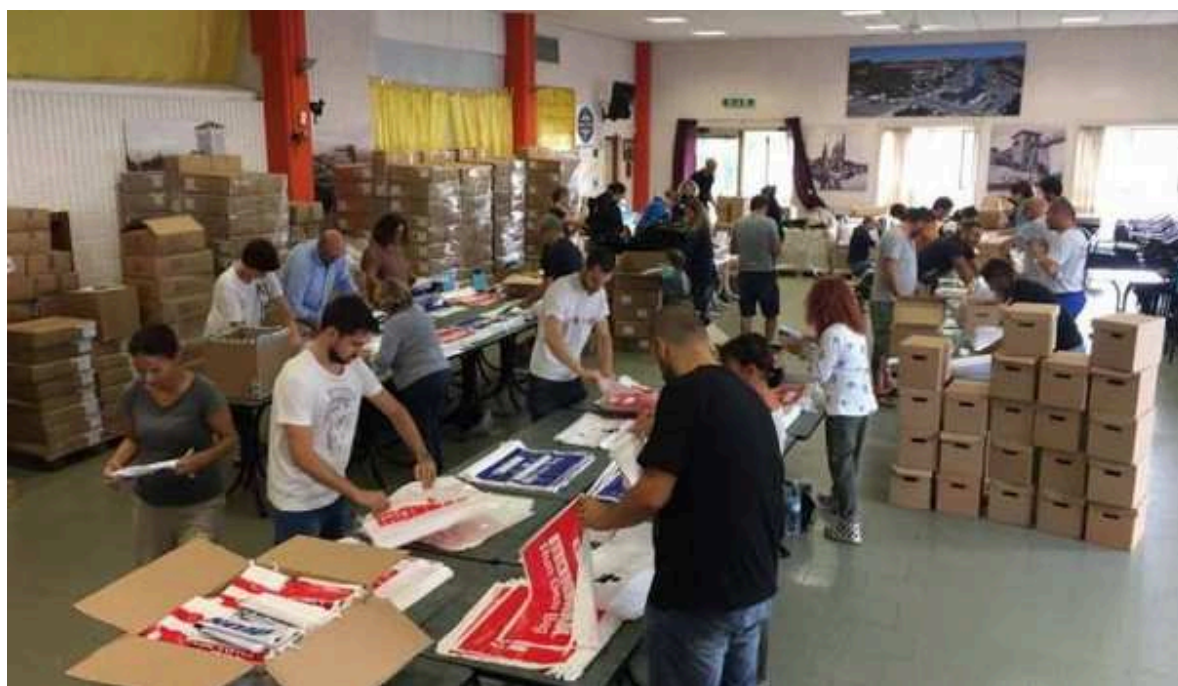
Ironman a Cervia, 1.500 volontari offriranno supporto agli atleti in gara

di ILARIA BEDESCHI / Pubblicato il 20 settembre 2017 ore 21:39