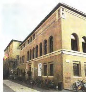
La biblioteca Oriani