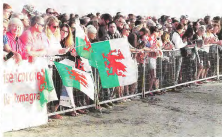
La partenza della gara dalla spiaggia, con il nuoto, e della frazione di ciclismo, in città. Il pubblico si è schierato lungo tutto il percorso