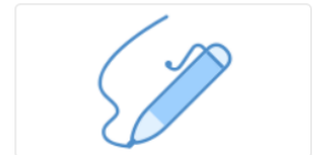
Riconoscimento con firma digitale