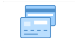
Riconoscimento con smartcard